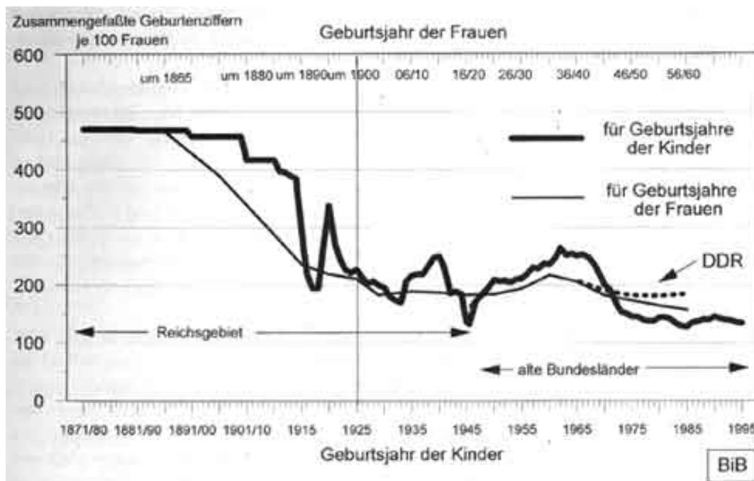
Рисунок 1. Коэффициент суммарной рождаемости за календарные годы (1871-1995) и итоговая рождаемость женских когорт 1865-1960 годов рождения, на 100 женщин в Германии (9).

На графике - две кривые. Одна из них, резко колеблющаяся, соответствует "поперечному" показателю - коэффициенту суммарной рождаемости. Вторая, намного более плавная, - когортные показатели, итоги рождаемости в реальных когортах женщин (а именно это - истинная рождаемость).